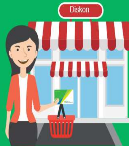
Promo & Diskon Belanja